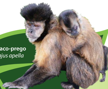
Macaco-prego Sapajus apella