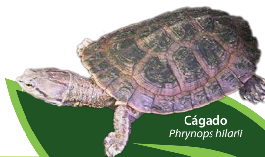
Cágado Phrynops hilarii