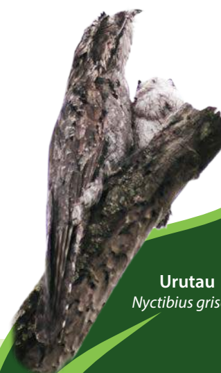
Urutau Nyctibius griseus