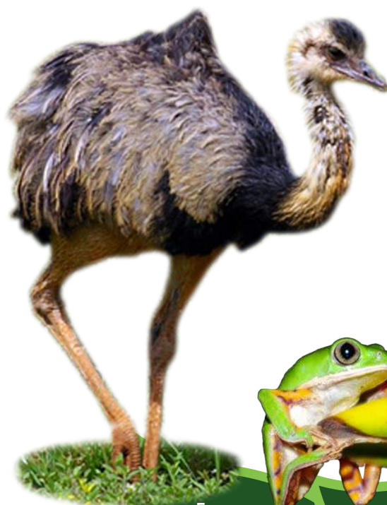
Emas Rhea americana

Um dos grandes atrativos deste parque é o Ribeirão Monjolo, que corre em meio a um exuberante vale. Esse Ribeirão, de águas brancas devido às inúmeras corredeiras e grandes paredões rochosos em sua margem, deixa o cenário ideal para contemplação da natureza e boas caminhadas.