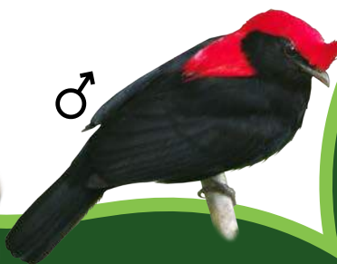
Soldadinho Antilophia galeata