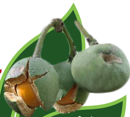
Pequi Caryocar brasiliense

Fruto nativo do Cerrado e muito utilizado na culinária local, como o famoso arroz com pequi.