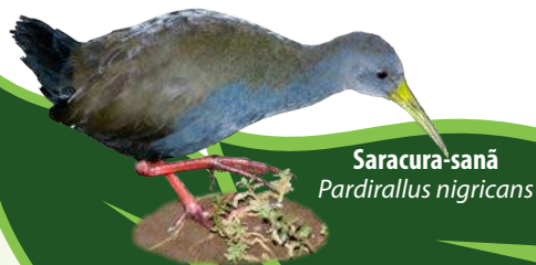
Saracura-sanã Pardirallus nigricans