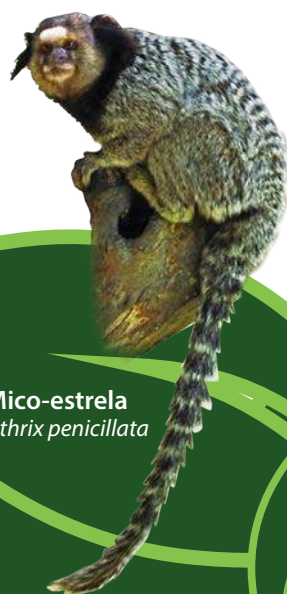
Mico-estrela Callithrix penicillata

Oferece uma das mais belas vistas do Lago Paranoá, que pode ser contemplada num passeio pela trilha que margeia o parque, além de vários piers . Vários esportes náuticos podem ser praticados, como o SUP (Stand Up Paddle) e o kite surf , pois o parque oferece adequado acesso ao Lago. Também possui um belo gramado onde é possível tomar sol ou passear, tendo como cenário a famosa Ponte JK.