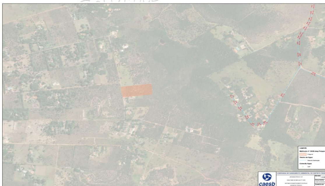
Figura 1: Cadastro de esgotamento sanitário – Croqui CAESB.

A Companhia informou que não consta interferência com redes de abastecimento de água implantadas, conforme cadastros fornecidos PDF (125447508).