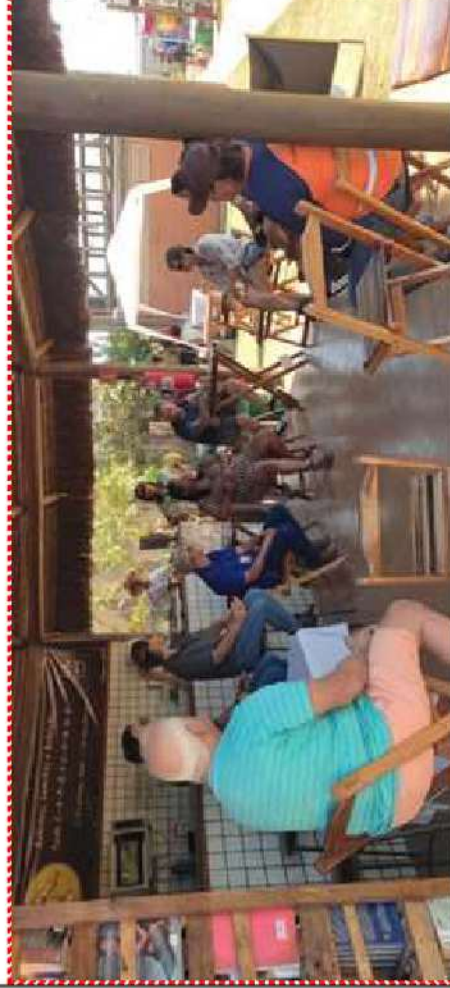
Foto 1: Roda de conversa realizada com catadores de materiais recicláveis, realizado em 2022

Fundado em 2015, o MCJB tem um amplo e consistente portfólio, com centenas de ações e projetos executados, voltados principalmente com temáticas comunitárias, ambientais e sociais, com foco principalmente em famílias carentes, como por exemplo, o projeto “Cesta do Bem” em 2020, organizado e executado em plena pandemia, apenas com recursos da sua própria comunidade, para ajudar as famílias de regiões carentes do Distrito Federal e entorno, entregando virtualmente cestas de verduras e alimentos em plena pandemia, utilizando a rede de pequenos comércios das cidades satélites assistidas pelo projeto. Outro projeto de referência é a “Fábrica Social JB” , criado em 2019 para gerar trabalho e renda para famílias de refugiados venezuelanos e cubanos que vieram procurar abrigo na cidade satélite de São Sebastião, no Distrito Federal ( confira reportagem TV Globo ).