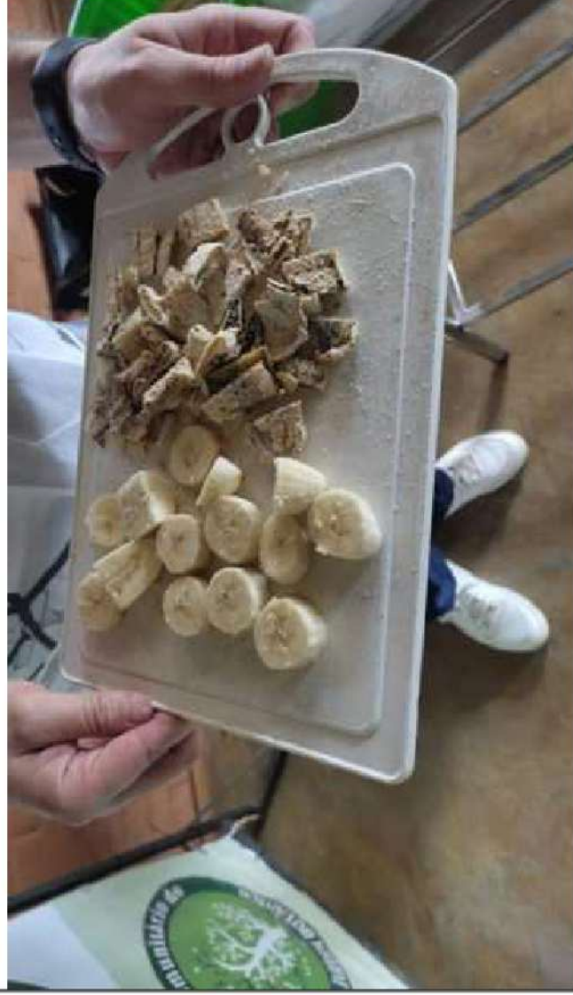
Foto 3: Oficina sobre Desperdício zero e sustentabilidade alimentar, realizada em 2023.