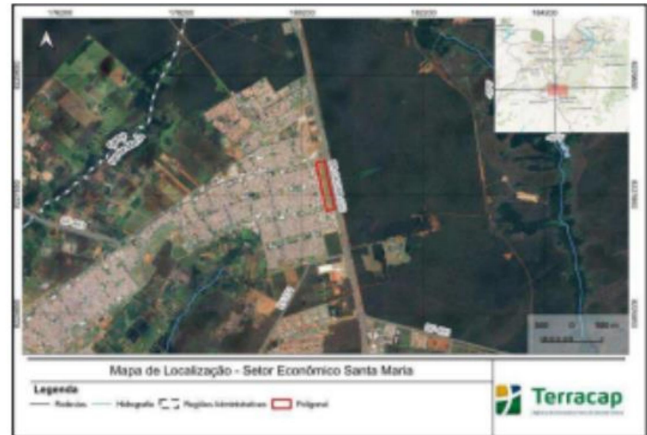
Figura 1: Mapa de Localização do Parcelamento Setor Econômico de Santa Maria.

O INSTITUTO DO MEIO AMBIENTE E DOS RECURSOS HÍDRICOS DO DISTRITO FEDERAL - BRASÍLIA AMBIENTAL - IBRAM/DF - convida todos os interessados para a Audiência Pública VIRTUAL para apresentação e discussão do Relatório de Impacto de Vizinhaça - RIVI para PARCELAMENTO DE SOLO URBANO, referente ao licenciamento ambiental (LICENÇA PRÉVIA - LP) do empreendimento denominado Parcelamento de Solo Urbano - SETOR ECONÔMICO DE SANTA MARIA, localizado na fazenda Saia Velha, na Região Administrativa de Santa Maria (RA XIII), Distrito Federal. INTERESSADO: Companhia Imobiliária de Brasília - TERRACAP. Processo de Licenciamento Ambiental nº SEI 00391-00004385/2023-96. Visando uma maior participação, a Audiência Pública será realizada de forma VIRTUAL, com ponto de acesso presencial e transmissão ao vivo, no dia 10 DE OUTUBRO DE 2024, com início às 19h00min e encerramento previsto para às 22h00min. As instruções relativas aos canais de transmissão e respectivos procedimentos para acesso e participação serão divulgadas previamente, no prazo mínimo de 5 (cinco) dias de antecedência da data de realização da audiência pública, no endereço eletrônico www.ibram.df.gov.br e ficarão disponíveis até o encerramento da Audiência Pública. Os estudos, regulamento da audiência e demais documentação poderão ser acessados por meio do endereço eletrônico www.ibram.df.gov.br .