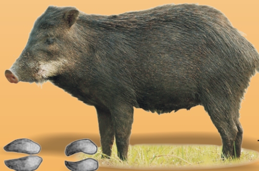
Queixada Tayassu pecari avistado ○