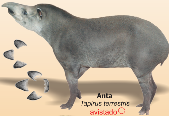
Anta Tapirus terrestris avistado ○