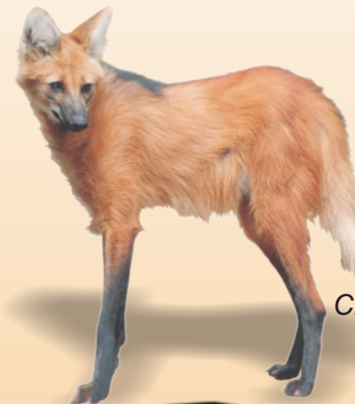
Lobo-guará Chrysocyon brachyurus avistado ○