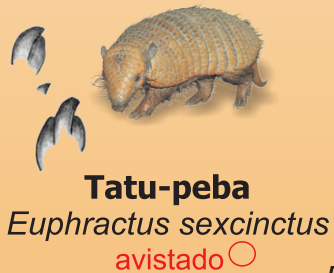
Tatu-peba Euphractus sexcinctus avistado ○