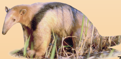
Tamanduá-mirim Tamandua tetradactyla avistado ○