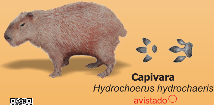
Capivara Hydrochoerus hydrochaeris avistado ○