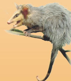
Saruê / Gambá Didelphis albiventris avistado ○