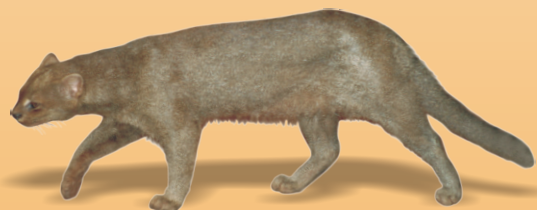
Gato-mourisco Puma yagouaroundi avistado ○