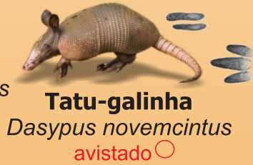
Tatu-galinha Dasypus novemcinctus avistado ○