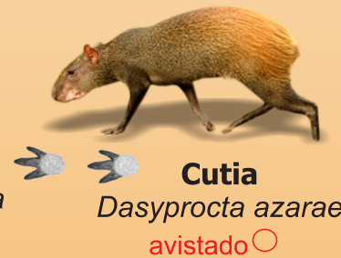
Cutia Dasyprocta azarae avistado ○