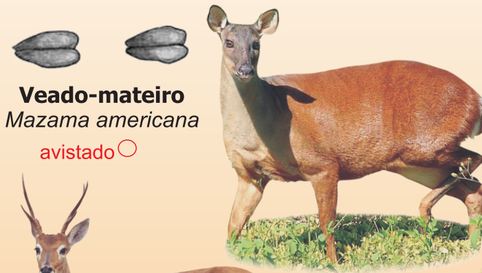
Veado-mateiro Mazama americana avistado ○