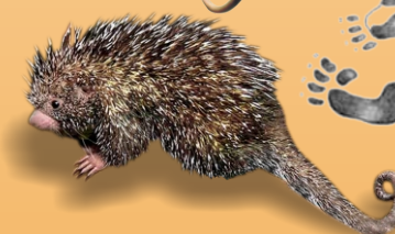
Porco-espinho Coendou prehensilis avistado ○