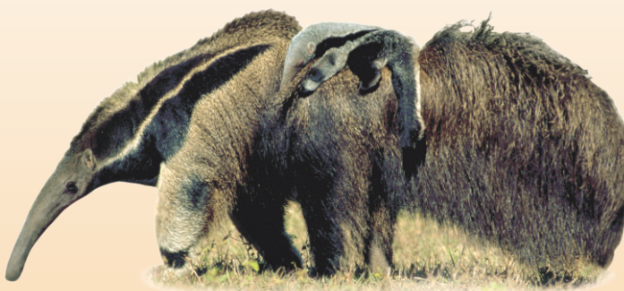
Tamanduá-bandeira Myrmecophaga tridactyla avistado ○