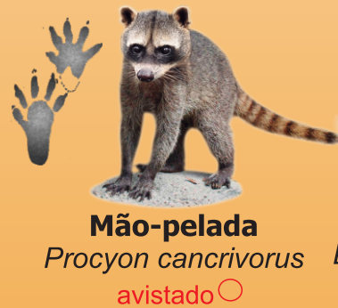
Mão-pelada Procyon cancrivorus avistado ○