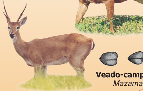
Veado-campeiro Mazama avistado ○