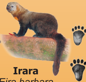
Irara Eira barbara avistado ○