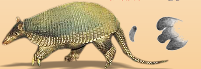
Tatu-canastra Priodontes maximus avistado ○