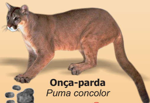
Onça-parda Puma concolor avistado ○