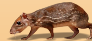
Paca Cunicullus paca avistado ○