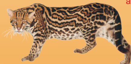
Jaguaririga Leopardus pardalis avistado ○