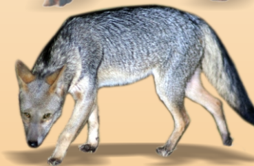
Cachorro-do-mato Cercocyon thous avistado ○