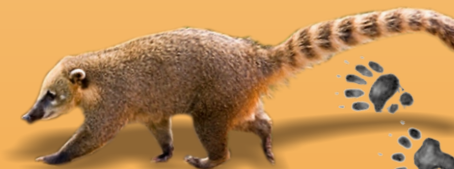
Quati Nasua nasua avistado ○