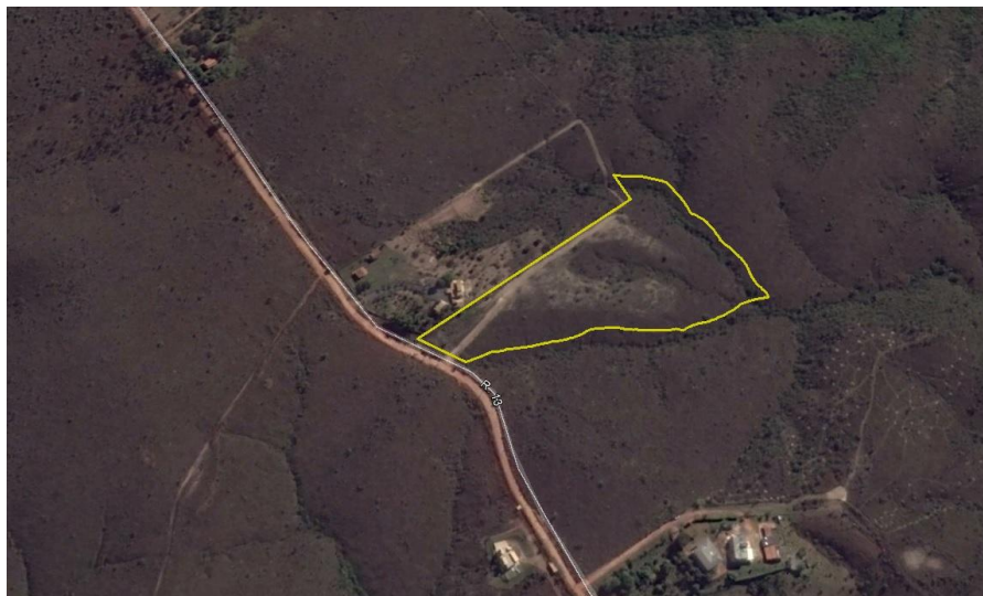
Figura 1 - Localização do empreendimento